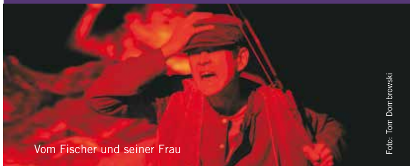
Vom Fischer und seiner Frau