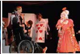
Götterspeise: Alice-verrückte Welten

Foto: Andreas Frücht, Video: Norbert Diekhake