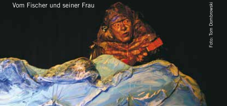
Vom Fischer und seiner Frau