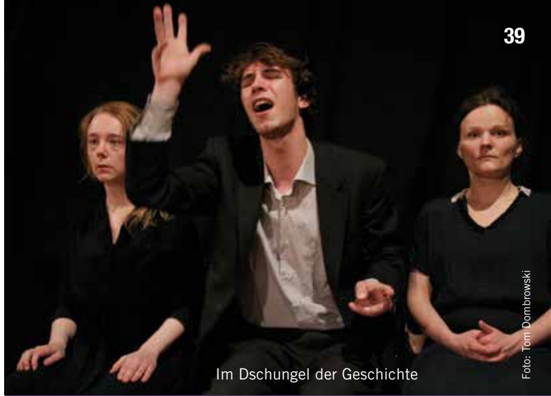
Im Dschungel der Geschichte