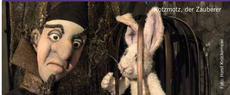
Kotzmotz, der Zauberer