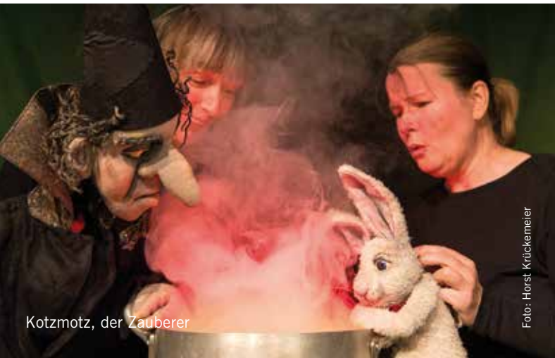
Kotzmotz, der Zauberer

Rückblickend war 2014 ein bewegendes und bewegtes Jahr für uns! Da war nach 36 Jahren der endgültige Abschied vom Puppen-theater in der Ravensbergerstraße. Da gab es den großen Umzug in unsere Übergangsspielstätte in der Meisenstraße gefolgt vom Einrichten im Kuks mit gleich 3 Neuinszenierungen, wovon wir Ihnen eine auf dieser Nachtreise in Auszügen vorstellen möchten. Auch das laufende Jahr verheißt viel Bewegung, denn ein Umzug kommt selten allein und wenn alles klappt werden wir die Tore zu unserer hoffentlich endgültigen Spielstätte bereits im Oktober öffnen. Diese eröffnet uns völlig neue Möglichkeiten der Gestaltung und unserem Publikum ein erweitertes Programm. Doch noch heißt es Daumen drücken, dass die restlichen Verhandlungen bald zum erfolgreichen Abschluss kommen, bevor die Koffer aufs Neue gepackt werden können. Darauf freuen wir uns zwar nicht übermäßig, dafür aber umso mehr auf das, was dann kommt! Sie dürfen gespannt sein. Wir sind es jedenfalls – wie ein Flitzebogen!